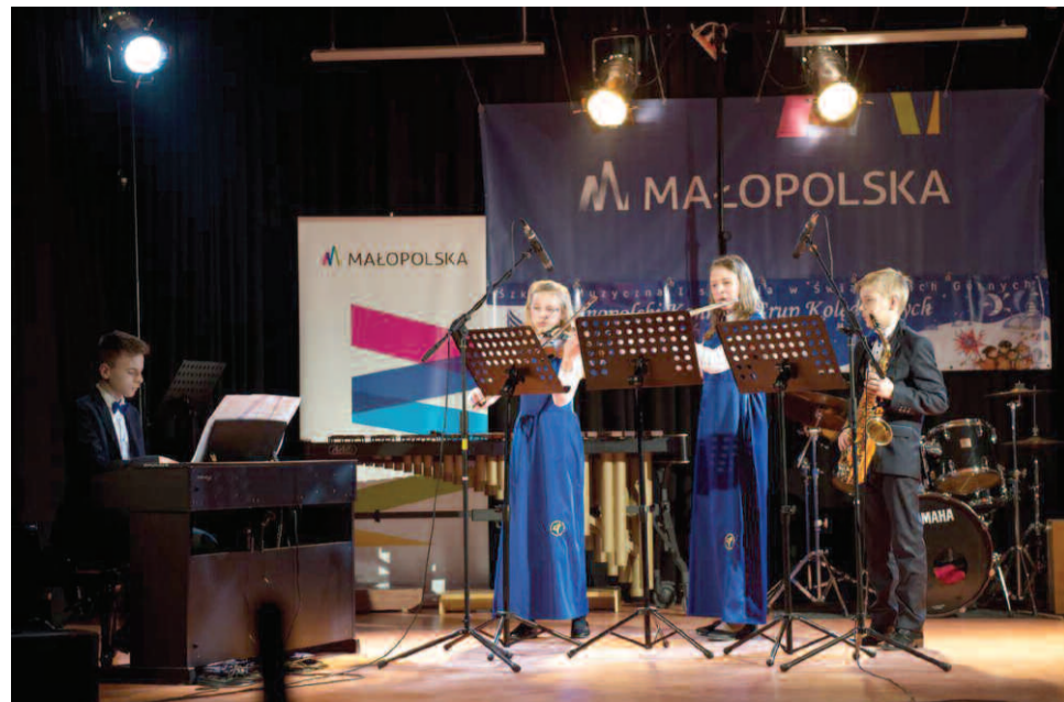
Laureaci w kategorii B- kwartet III miejsce