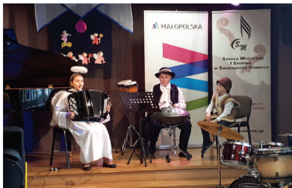
Laureaci w kategorii B- kwartet III miejsce