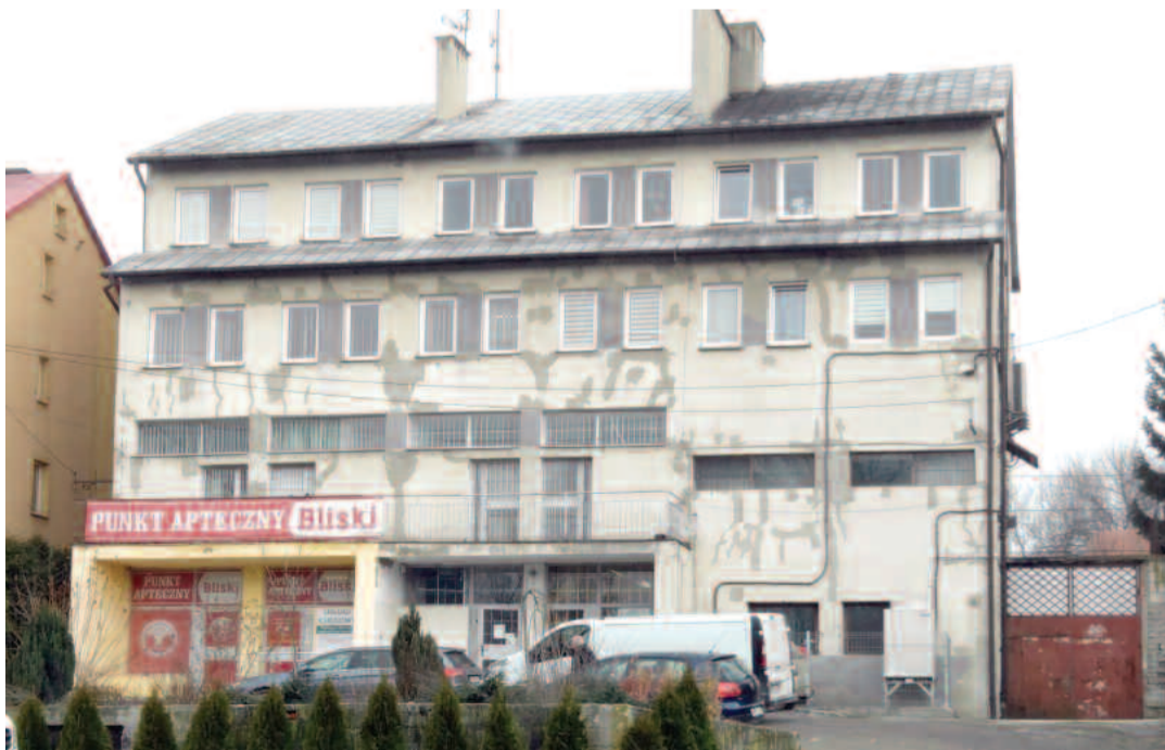
Budynek Urzędu Gminy Pałecznicza

Domy Ludowe w Niezwojowicach i Lelowicach-Kolonii oraz budynek Urzędu Gminy w Pałeczniczy doczekają się termomodernizacji. Te inwestycje będą kosztować ponad 1,5 miliona złotych.