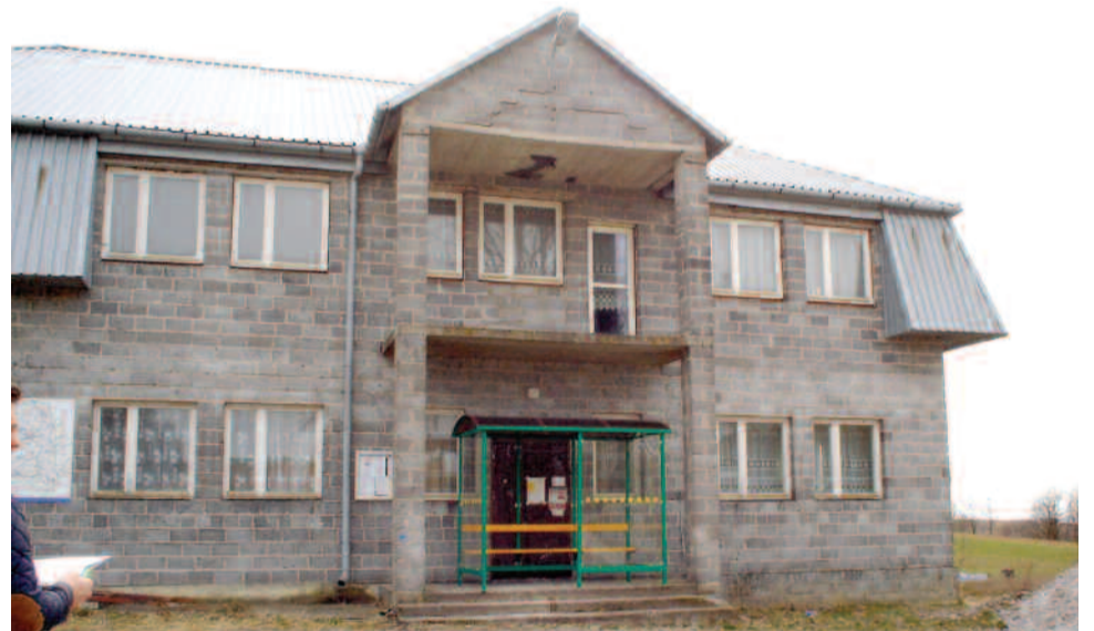
Budynek Domu Ludowego w Niezwojowicach

W budynkach Domów Ludowych planowane są: wymiana pokrycia dachowego oraz okien i drzwi, a także ocieplenie ścian