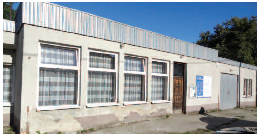
Budynek Domu Ludowego w Lelowicach Kolonii

Piec miałowy zastąpi pompa ciepła; zainstalowany zostanie nowy system centralnego ogrzewania. Budynek zostanie ocieplony styropianem i zyska nową elewację.